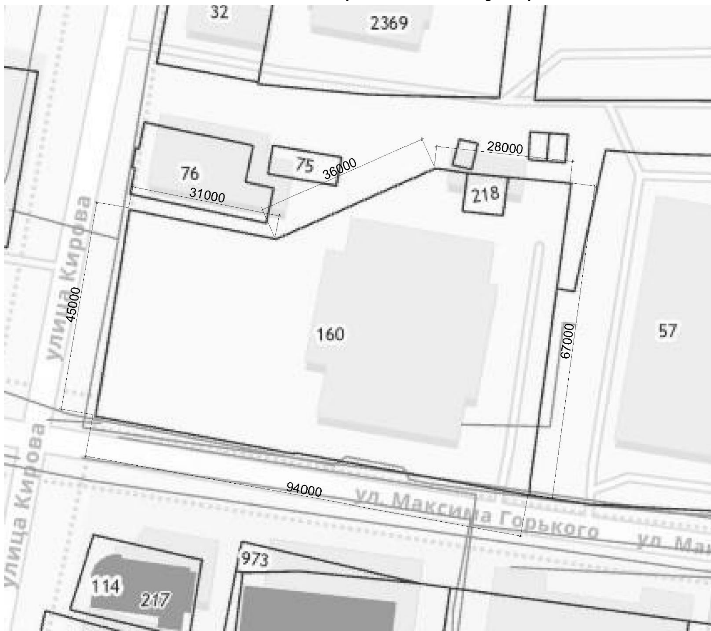
Участок под застройку